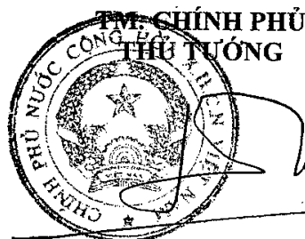
Nguyễn Tấn Dũng